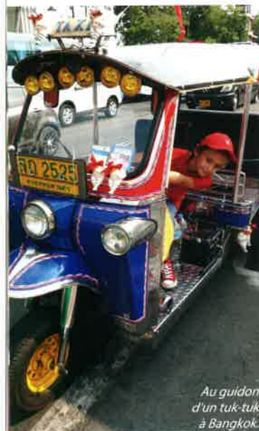
Au guidon d'un tuk-tuk à Bangkok

When I was younger, I used to come to the island for vacation, but a few years ago we made several films about the island for the Gulli channel as part of the Arthur Around the World series. We then created an album that explains to children how their parents and grandparents used to live. Now, I spend part of my time here and even attend school on the island.