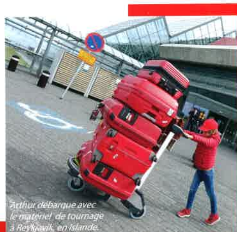
Arthur débarque avec le matériel de tournage à Reykjavik, en Islande.