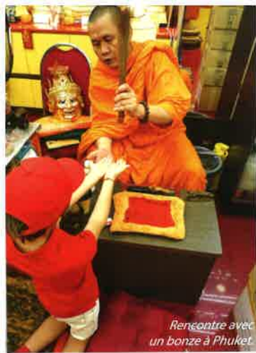
Rencontre avec un bonze à Phuket