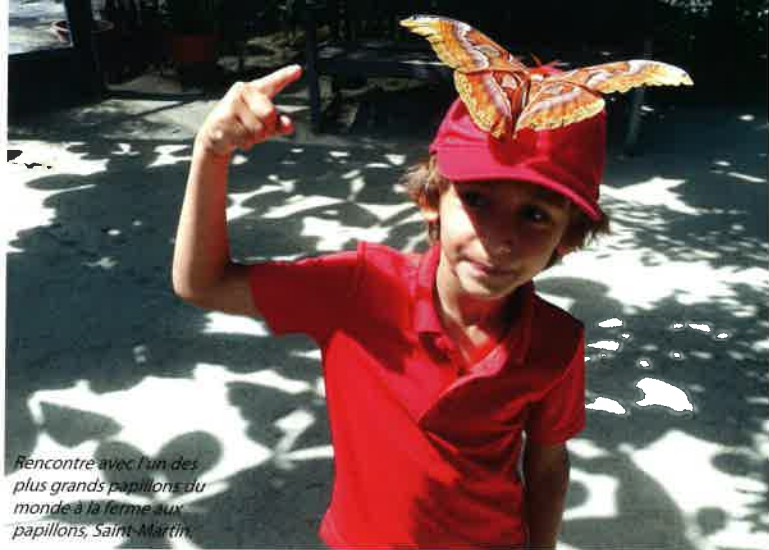
Rencontre avec l'un des plus grands papillons du monde à la ferme aux papillons, Saint-Martin.