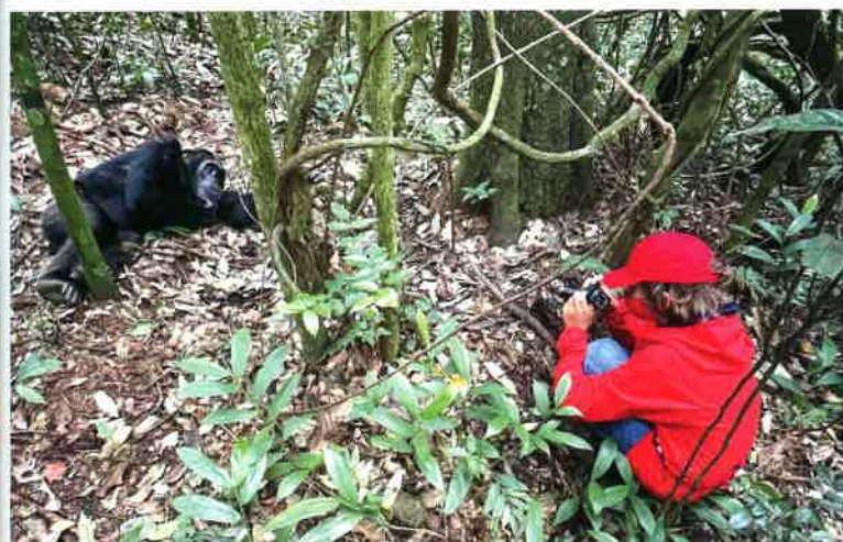
Arthur a pu approcher de très près un chimpanzé endormi pour le photographier.