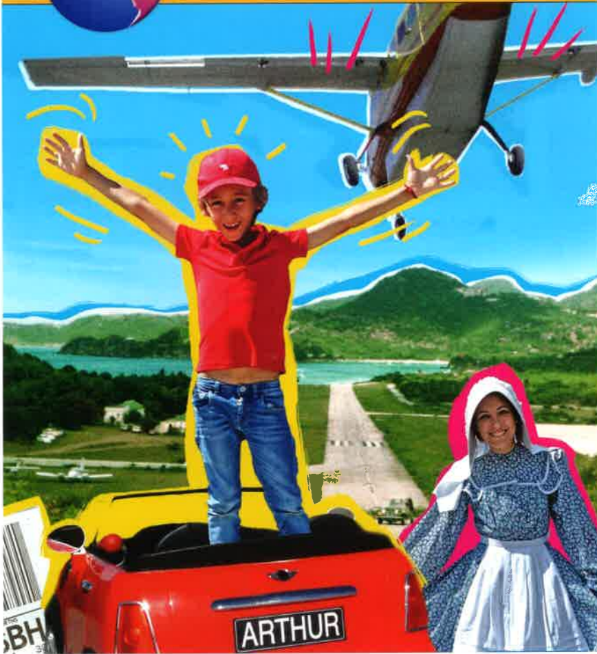
Couverture de l'album Arthur explore le passé de Saint-Barth édité par la Collectivité à l'intention des enfants de l'île.