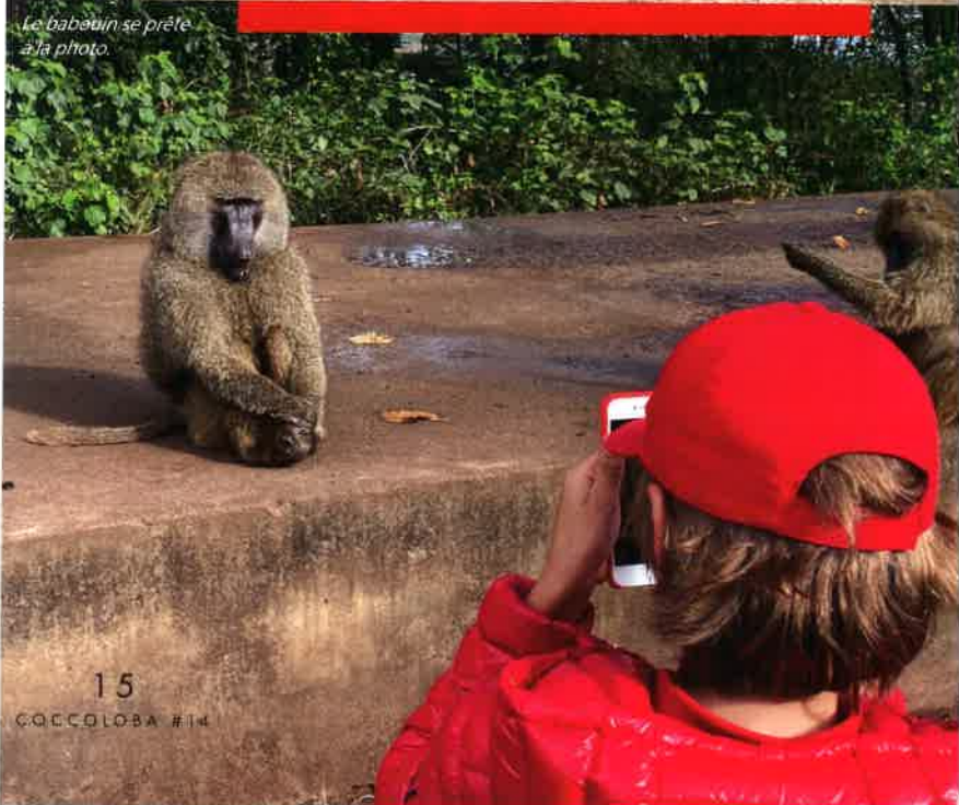
Le babouin se prête à la photo.

Oui, j'ai vu des pays très pauvres comme l'Inde ou l'Ouganda et très riches comme Monaco ou les Émirats Arabes Unis. Ça m'a choqué de voir des enfants travailler dans les champs pour à peine un dollar par jour, de l'argent qui va à leurs parents. Chez nous, les enfants ne se rendent pas compte de la chance qu'ils ont de pouvoir aller à l'école. Dans les pays pauvres, beaucoup d'enfants rêvent d'y aller mais n'en ont pas la possibilité.